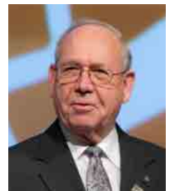
Ray Klinginsmith Presidente electo del Consejo de Fiduciarios de La Fundación Rotaria

Durante la sesión general de la Asamblea Internacional del jueves 22 de enero, Ray Klinginsmith, presidente electo del Consejo de Fiduciarios, expuso estas prioridades a los gobernadores electos que asumirán sus cargos el próximo mes de julio.