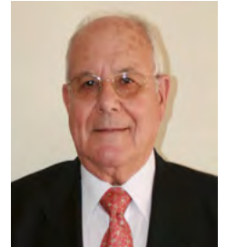
Antonio Navarro Quercop Gobernador de Rotary

El presidente mundial de Rotary International, Gary C. K. Huang nos propone, para este año 2014-2015, el lema "LIGHT UP ROTARY", que se puede traducir por "ILUMINEMOS ROTARY".