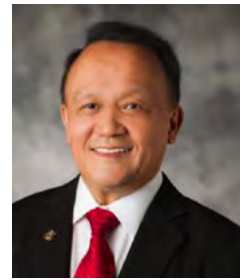
Gary C.K. Huang Presidente de Rotary Internacional

Nuestro lema, Iluminemos Rotary, representa nuestro modo de ver el mundo y nuestro papel en él como rotarios. Nosotros no queremos que nadie permanezca en la oscuridad. Por eso, los 1,2 millones de rotarios debemos unirnos e Iluminar Rotary. Esa es nuestra meta y el reto que les lanzo.