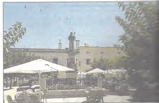
Participantes y organizadores del programa, sede central y plaza del Pare Serra de Petra. T.O.

Serra, internacionalmente el Evangelizador de California o Apóstol y Civilizador -canonizado como santo por el papa Francisco en septiembre de 2015-, en pleno centro de Petra. Este martes habrá recepción a los jóvenes por parte del incombustible presidente de la Asociación de Amigos de Fray