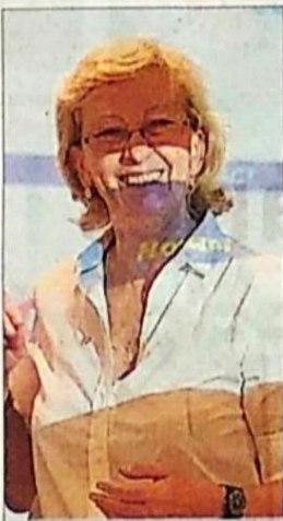
Massot vincula la iniciativa amb una actitud de servei a la societat.

tar treballs en anglès. També es durà a terme un festival musical juvenil. D'altra banda — i coincidint amb que un dels patrocinadors més importants és una bodega — es tractarà el tema de què els joves aprenguin a beure vi de forma responsable i les conseqüències que pot representar a ells el